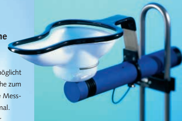
Der hygienische Metallrand des Trichters erleichtert das Reinigen.